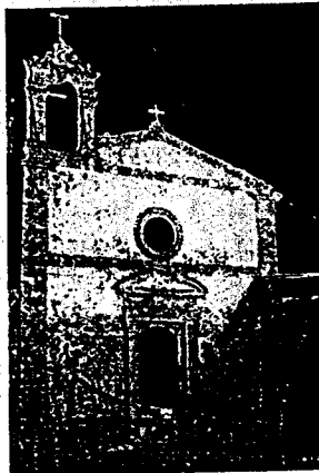
L'antica chiesetta della tonnara di Marzamemi diventerà uno spazio culturale

Su disposizione dell'assessore regionale dei Beni Culturali, Fabio Granata, è stata acquisita al patrimonio della Regione la Chiesetta della Tonnara di Marzamemi, al fine di "sottrarla al degrado e di utilizzarla quale piccolo, ma significativo, contenitore culturale". Per l'assessore Granata si tratta di un altro significativo tassello di difesa e arricchimento del patrimonio culturale siciliano.